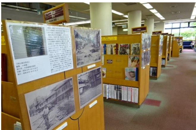
2019 昭和9年室戸台風災害時の写真展