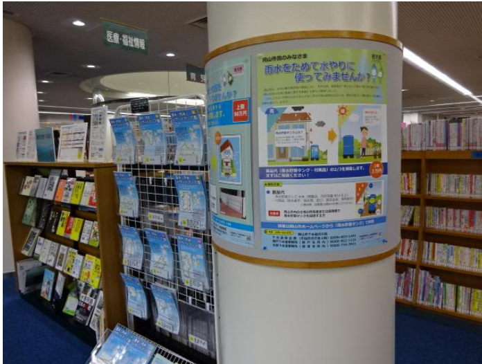
2022 展示架・浸水(内水)ハザードマップ