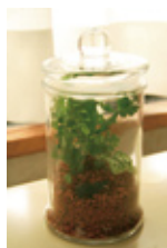
A C D 観葉植物の テラリウム