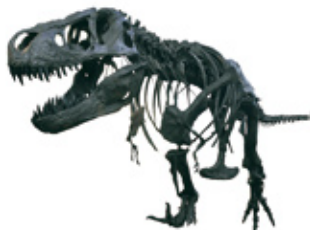
▲ティラノサウルス