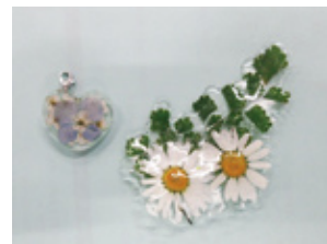
D 押し花の 小物づくり

灘崎 〒709-1215 南区片岡186 ☎086-362-5277 開館時間 9時～17時 休館日 月・第2日曜、祝日