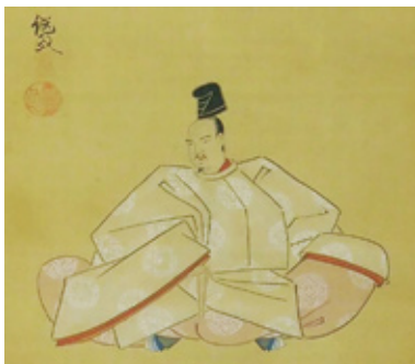
▲池田継政 画 九条兼実（一部）個人蔵