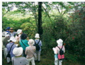
B 四季と自然を 楽しむ会