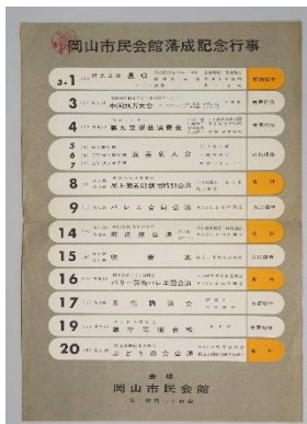
岡山市民会館落成記念行事のチラシ