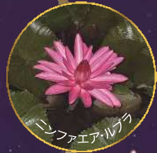
ニンファエア・ルブラ