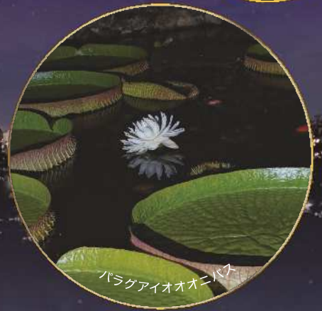
パラグアイオオオニバス

カラスウリや ニンファエア・ルブラ、 パラグアイオオオニバスなど 夜咲く花を楽しむ3日間