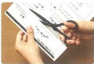
1 翻訳シールを切る

写真の絵本『わたしのワンピース』 作：西巻 孝子、出版社：こぐま社