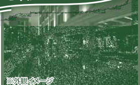
美麗信花園酒店 ミラマーガーデン台北 Miramar Garden Taipei

◆最少催行人員：15名様 ◆利用予定航空会社：タイガーエア利用 ◆利用ホテル：美麗信花園酒店(ミラマーガーデン台北)、新竹福華大飯店(ハワードプラザホテル新竹) ◆添乗員：岡山空港から岡山空港まで同行します。 ◆食事：朝3回・昼3回・夕3回(昼食1回機内食含む) 燃油サーチャージ、現地空港税は旅行代金に含まれます。