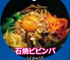
石焼ビビンバ (イメージ)