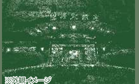
新竹福華大飯店 ハワードプラザホテル新竹 The Howard Plaza Hotel Hsinchu

2023年2月リニューアルオープン。日本語対応可能。細やかな心配りでお客様に接する台湾旅行初心者でも安心して泊まれるホテルです。