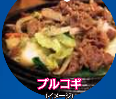
ブルコギ (イメージ)