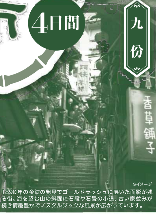
1890年の金鉱の発見でゴールドラッシュに沸いた面影が残る街。海を望む山の斜面に石段や石畳の小道、古い家並みが続き情趣豊かでノスタルジックな風景が広がっています。

新竹市は、台北市の南西約80キロメートルに位置している、岡山市の国際友好交流都市です。新竹の古い名前は竹塹(たげざん)といい、清代に新竹と改名されました。亜熱帯気候で、季節風が強く吹きつける新竹はその強風で全国的に知られており、別名「風城」とも呼ばれています。強風を利用して作られるビーフンやガラス工芸が特に有名です。1980年以降整備されたサイエンスパークには、理工系の学術研究機関が立地し、600社を超えるハイテク企業が進出するなど、現在、台湾のシリコン・バレーとして世界のIT産業の最先端を担っています。