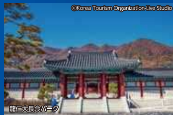
龍仁大長谷パーク