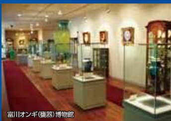
富川オンギ(甕器)博物館