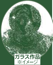
ガラス作品 ※イメージ

新竹市は、台北市の南西約80キロメートルに位置している、岡山市の国際友好交流都市です。新竹の古い名前は竹塹(たげざん)といい、清代に新竹と改名されました。亜熱帯気候で、季節風が強く吹きつける新竹はその強風で全国的に知られており、別名「風城」とも呼ばれています。強風を利用して作られるビーフンやガラス工芸が特に有名です。1980年以降整備されたサイエンスパークには、理工系の学術研究機関が立地し、600社を超えるハイテク企業が進出するなど、現在、台湾のシリコン・バレーとして世界のIT産業の最先端を担っています。