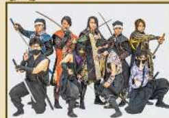
安芸ひろしま武将隊