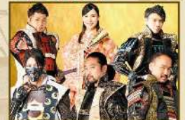
熊本城おもてなし武将隊