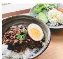
ラウンジ・カド [ルーローハン他]