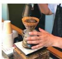
純喫茶松野 [コーヒー]