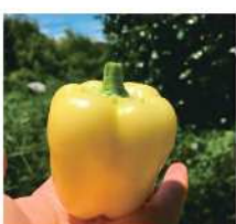
小鶴農園 [オーガニック野菜他]