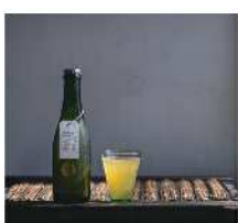
久福ブルーイング 本島 [ビール]