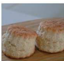
みちくさスコーン [スコーン・紅茶]