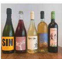
プレヴァナン [ワイン]