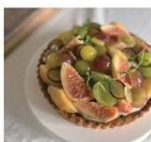
菓子屋SANICO [焼き菓子・生菓子]