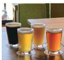
マイルストーン ブルーイング [ビール]