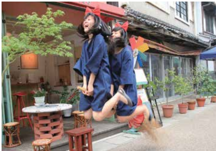
▲魔女飛び撮影会の様子

令和の時代にはなかなかできない、こま回しなどのレトロ遊び体験も考えていますので、ぜひ会場へお越しください。