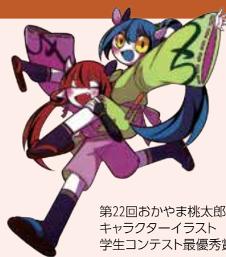
第22回おかやま桃太郎まつり キャラクターイラスト 学生コンテスト最優秀賞

郷土の食と芸能と歴史をテーマとするお祭り「秋のおかやま桃太郎まつり」を今年も開催します。県内外の地域自慢のグルメが大集合する「ふるさと食の自慢市」や、郷土芸能などの野外ステージ、迫力満点の鉄砲隊の演武、家族で楽しめるこども広場など、多彩な企画で岡山城一帯を盛り上げます。