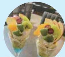
五福カフェのバフェ付♪ (写真は2人前/イメージ)