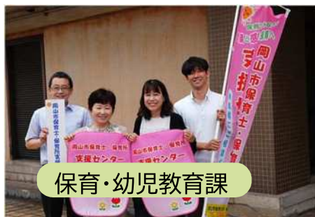
保育・幼児教育課

【課題概要】 私立園向けの補助金の種 類が多く、多くの時間を要 しているため、補助金申請 等のデジタル化を進めたい。