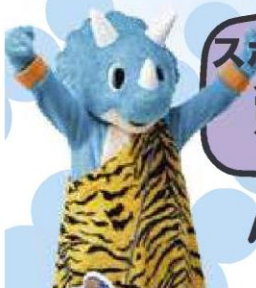
トライフーフ岡山 マスコットキャラクター 「トライフ」

【主催】岡山市 【協力】トライフーフ岡山 【お問い合わせ先】岡山市スポーツ振興課 TEL:086-803-1616