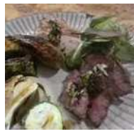
RONI RONI 6262