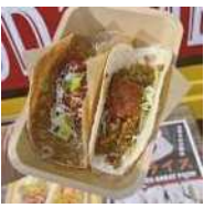
モータウンタコス