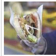
アリババトルコ料理レストラン