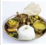
ネパール家庭料理 ダルバート