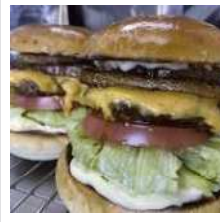
BURGER BOX BAM