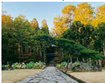
中央通路。夏には両側に蓮とアジサイが美しい花を咲かせます。