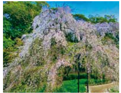
春には見事なしだれ桜が見られます。