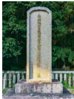
岡山藩の歴代藩主や近親者の墓が玉垣で囲まれ、整然と配置されています。