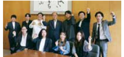
▲市長を表敬訪問したときの様子

各分野のプロフェッショナルなど、多彩な活躍をしている人たちです。また中学生から40代までと幅広い年齢層で構成されています。