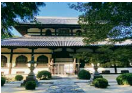
本堂（仏殿）。1780年に焼失し、現在の本堂は1824年に再建されたもの。岡山市重要指定文化財に指定されています。