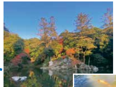
秋には、もみじやイチョウが美しく色付き、紅葉を楽しむ観光客でにぎわいます。池の鯉は1年中元気に泳いでいます。