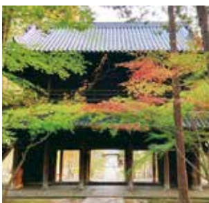
山門。新緑、紅葉、雪景色など、四季によりさまざまな表情が見られます。