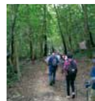
C ノルディックウォーク(中級コース)

瀬戸町 〒709-0856 東区瀬戸町下188-2 ☎086-952-4531 開館時間 10時～18時 休館日 月曜、第2日曜、祝日、12/28～1/4