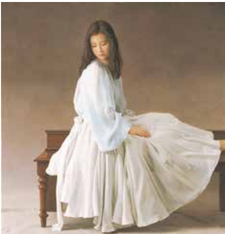
森本卓介「未来」2011年 ホキ美術館