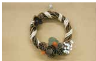
A 自然素材でミニリース作り