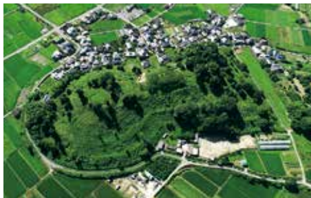
造山古墳（北西側上空から） 吉備の古墳展

近年の発掘でその様相が明らかになってきた市内の造山古墳や金蔵山古墳など、大和王権に匹敵する古墳を築き、さらには大王へ反乱した伝承を有する吉備の実力を考古資料からたどります。