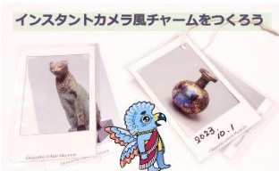
インスタントカメラ風チャームをつくろう

インスタントカメラ風チャームと古代のコロコロスタンプ(円筒印章)を作ることができます。