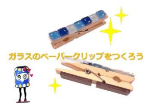
ガラスのペーパークリップをつくろう

ガラススタイルを組み合わせ、ペーパークリップを作ってみませんか？ お一人につき2個作ることができます。