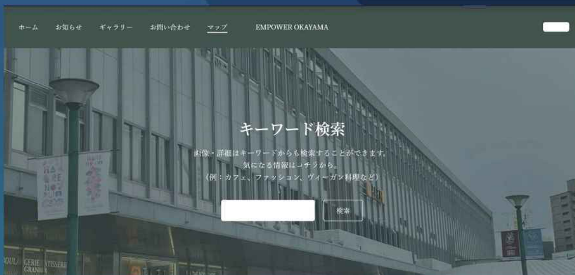
キーワード検索画面イメージ