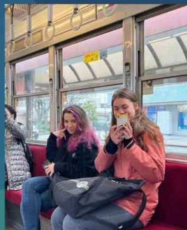
画像：ツアーの様子