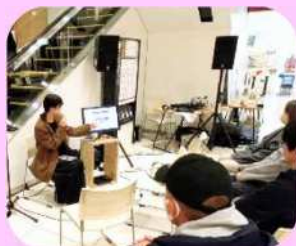
無印良品 イオン岡山とのコラボイベント