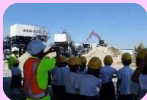
リサイクルセンター見学

企業のSDGsの取組事例とともに、その取組が社内外に与える影響について考えます。SDGsの推進に必要なもの、ヒントを話し合いたいです。