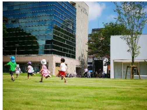
下石井公園芝生広場(東半面)の利用風景