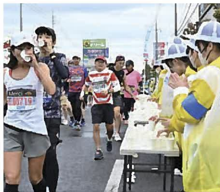
コース沿道 給水給食

給水所で水やスポーツドリンク、給食を提供します。長時間走り続けるランナーにとって欠かせない場所です。