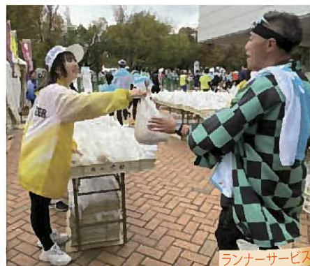
ランナーサービス