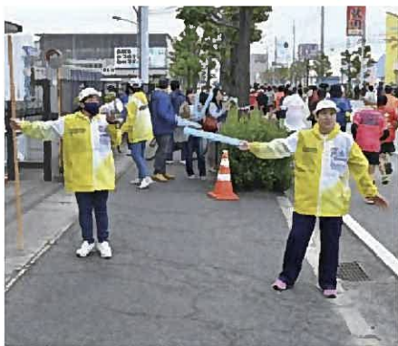
コース沿道 沿道整理 トイレ誘導

ランナーの手荷物返却、会場誘導・案内などを行います。ランナーサービスでは、完走後のランナーを笑顔で出迎えながら、フィニッシュタオルや完走メダルなどを手渡ししましょう。