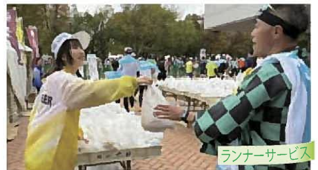
ランナーサービス