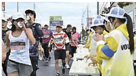
コース沿道 給水給食