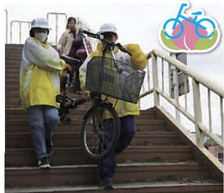
コース沿道 お運びボランティア

※準備のため重い荷物を運びます。また、屋外で長時間立ったままでの活動になります。