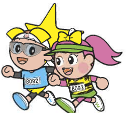
岡山県マスコット「ももっち・うらっち」