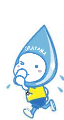
岡山市イメージキャラクター「ミコロ・ハコロ」