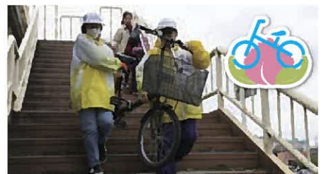
コース沿道 お運びボランティア

ランナーに安全に走ってもらうため、コース上への観衆の飛び出しや横断防止、ランナーの仮設トイレ誘導などを行います。