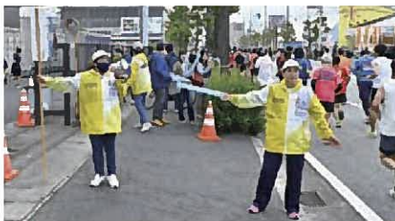
コース沿道 沿道整理 トイレ誘導

ランナーの手荷物返却、会場誘導・案内などを行います。ランナーサービスでは、完走後のランナーを笑顔で出迎えながら、フィニッシャータオルや完走メダルなどを手渡ししましょう。