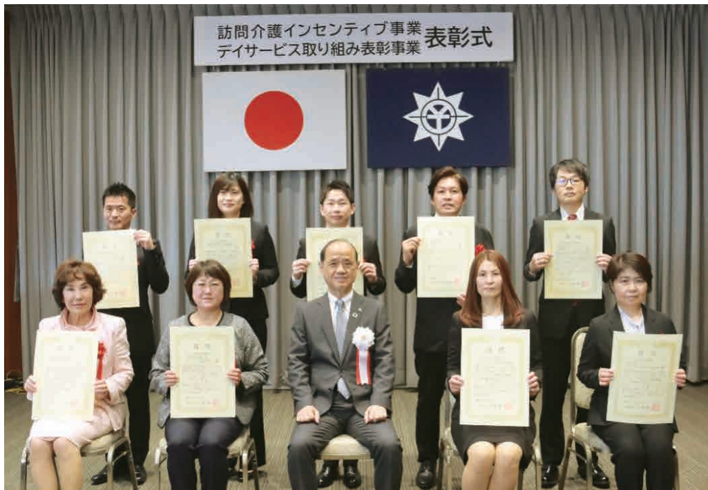
デイサービス取り組み表彰事業