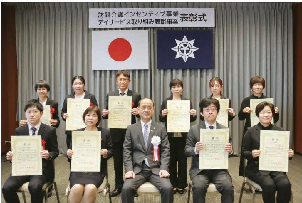
総合特区訪問介護インセンティブ事業