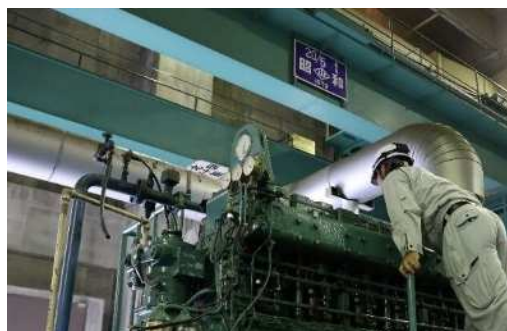
ディーゼルエンジン点検の様子 （平井排水センター）