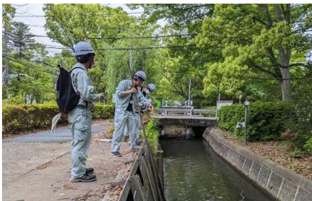
R5.5.16操作訓練実施状況 (津島第5ゲート)