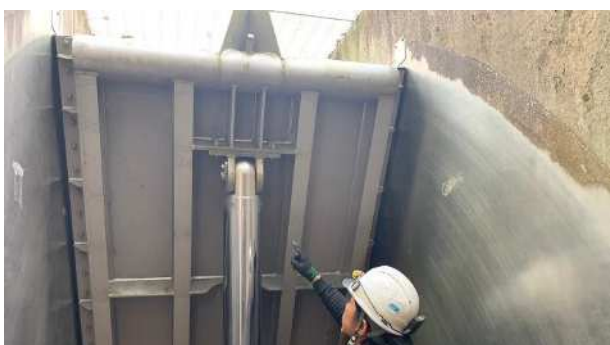
R5.4.6保守点検実施状況 (津島第5ゲート)