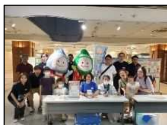
9月24日 街頭キャンペーン実施 (エキチカひろば)