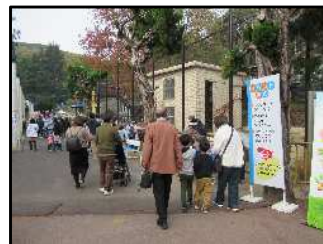
11月23日 動物愛護フェスティバル (池田動物園)