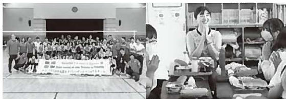
海外代表チームの強化合宿受入 (写真:ドミニカ共和国ナショナルチーム)

岡山シーガルズは国内バレーボール競技のトップカテゴリーであるSVリーグに所属するチームの中でも数少ない地域密着型市民クラブチームです。競技活動以外にもバレーボール教室や各種啓発活動をはじめ年間200回にも及ぶ地域活動に積極的に取り組んでいます。