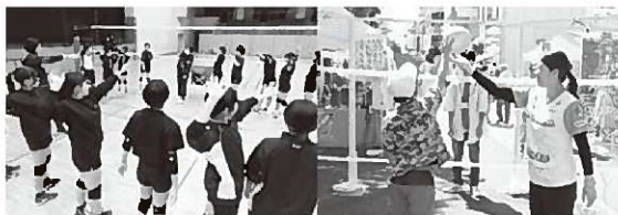
バレーボールの普及・発展・強化