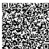
電子申請フォーム