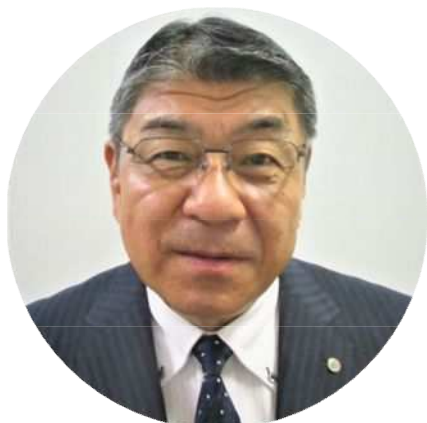
教育長 三宅 泰司