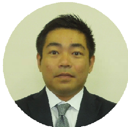
教育長職務代理者 石井 希典