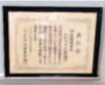
中区健康市民おかやま21推進会が「おかやま健康づくりアワード2021（地域部門）」を岡山県より受賞しました！！（令和3年9月）