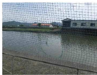
防球ネットの破れ