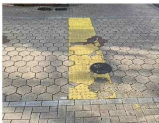
点字ブロックの破損