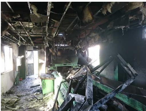
処理施設が全焼した事例

モバイルバッテリーやスマートフォン、電子タバコなどに使われているリチウムイオン電池が可燃・不燃ごみや資源に混ぜて排出されたことで、処理施設で発火が発生するなど施設運営に支障が出ています。岡山市のリサイクルプラザで発生したリチウムイオン電池を原因とする発火件数は、令和5年度で268件と、5年前と比較して約3倍に急増しています。