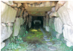
▲牟佐大塚古墳（石室）

一方、岡山市にも同じ時代に石舞台古墳とほぼ同じ大きさの石室が築かれています。北区牟佐の牟佐大塚古墳です。日本遺産の構成文化財の一つで、井原市で産出される石材を使った巨大な石棺が置かれています。古墳の位置は備前国赤坂郡ですが、赤坂郡は南の上道郡と一体であったと考えられています。上道郡は備前国で最も勢力のあった上道