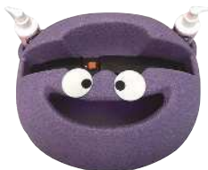
手指衛生の機器 グリッター バグ