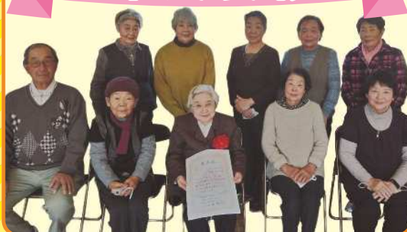
あっ晴れ！もも太郎体操 参加者表彰