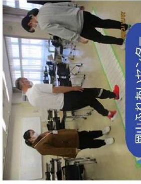
岡山ふれあいセンター