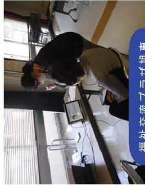
福祉交流プラザ旭東