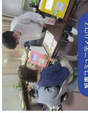
旭東コミュニティハウス