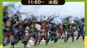
備州岡山城鉄砲隊 演武