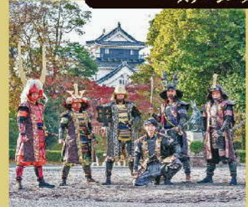
グレート家康公「葵」武将隊 15:00～