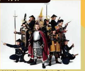
名古屋おもてなし武将隊 16:00～