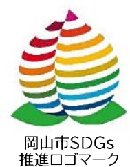
岡山市SDGs 推進ロゴマーク