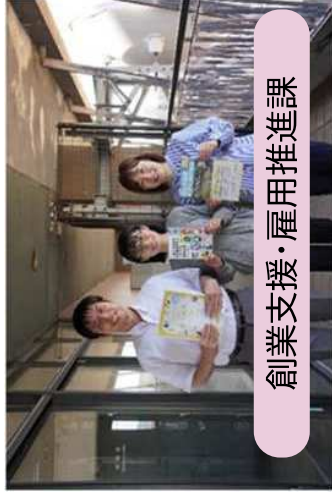
創業支援・雇用推進課