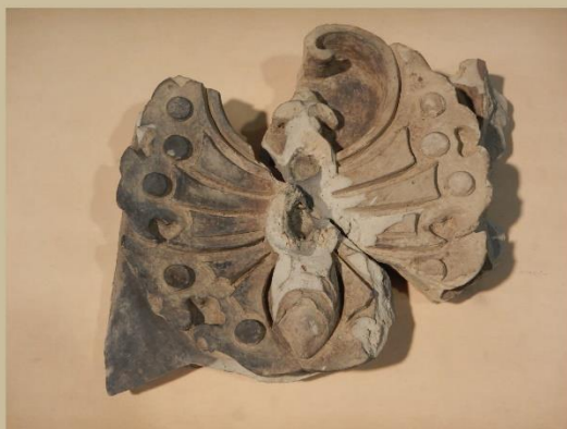
揚羽蝶文鬼瓦 / 岡山城下の段