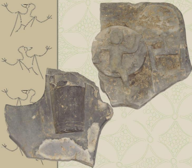
人物文鬼瓦 / 岡山中城の段