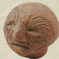
鯨面文身土偶 / 津寺遺跡