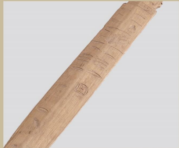
木製剣 / 南方遺跡