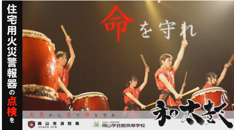
【デジタルサイネージの一部】