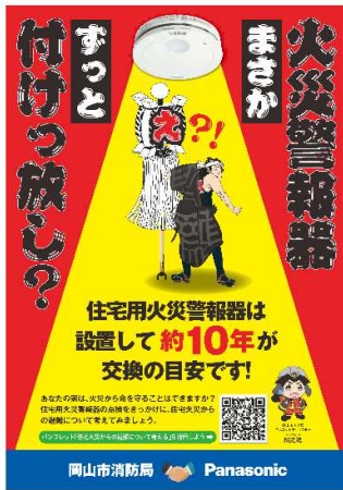
【Panasonic との合同啓発チラシ】