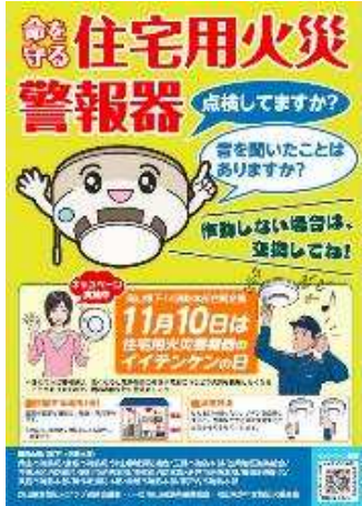
【県下合同の啓発チラシ(イメージ)】