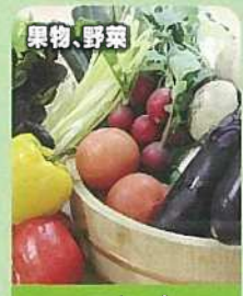
果物・野菜 つむぐ