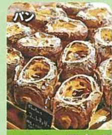
パン ヘルメス下中野

農作物の販売 会場/イベントスペース 販売予定 _____ 卵、野菜、花、果物 etc.