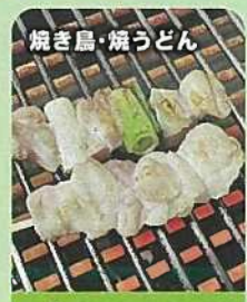
焼き鳥・焼うどん パチャマンカ