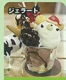
ジェラート みさお牧場

ハーバリウムづくり体験 会場/南区役所4階 特別体験料/300円 定員/各回25人 ① 11:00 ② 13:30 各回の30分前に参加者抽選を行います。 ※詳しくはホームページをご覧ください。