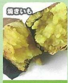
焼きいも おいも屋ツヨ

主催 岡山市南区役所 お問い合わせ先/ TEL 086-902-3502 後援 岡山市教育委員会