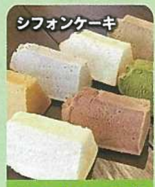
シフォンケーキ ベーカー・エム