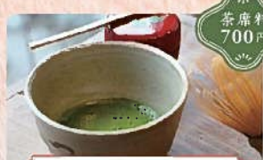
お庭茶会「はつはるの会」