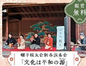
囃子桜友会新春演奏会 「文化は平和の源」

●時間/1回目 開演11:30~2回目 開演12:30~ ●会場/能舞台 [※入れ替わり] ●主催/田賀屋狂言会