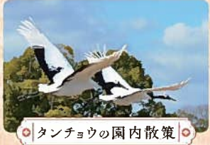
タンチョウの園内散策