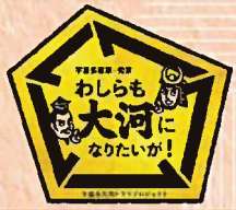
鳥城で立てよう! 今年の野望!

●時間/10:00~16:00 岡山城下の段広場で、思いっきり凧揚げを楽しもう!