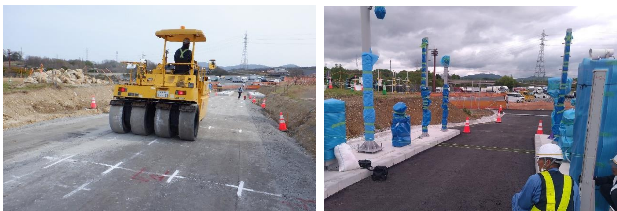
《スマートIC 改築工事》