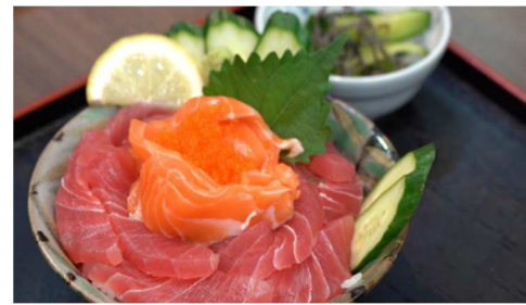
ふくふく通り(関連商品売場棟)で食事