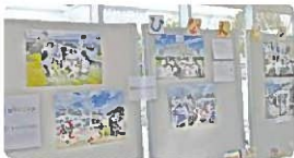
展示「私の合理的配慮」