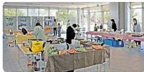
福祉事業所販売 (※R4年度の様子)