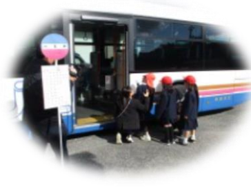
バスのインターホン体験