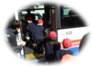
整理券をとってバスに乗車