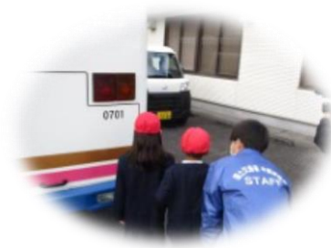
後方の危ない場所を学習