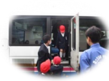
非常脱出口の確認