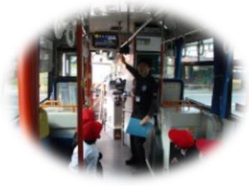
運賃の支払方法を学習