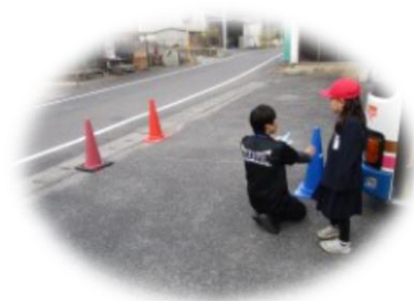
前方の死角を確認