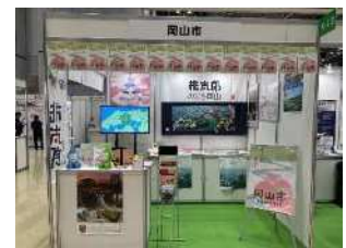
展示会出展イメージ