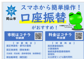
ポケットティッシュ