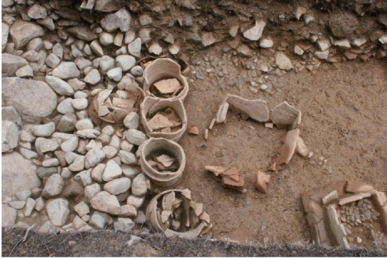
平成 26 年度発掘調査時 造り出し埴輪、葺石検出状況（北から）