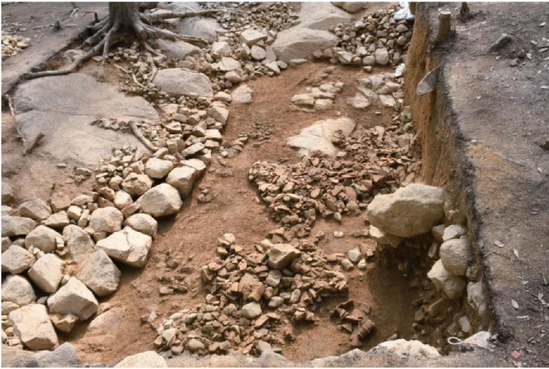
平成 29 年度発掘調査時 墳丘－島状遺構間の埴輪出土状況（北から）