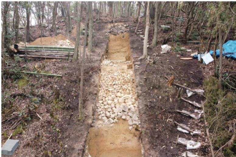
令和元年度発掘調査時 前方部 第 2～3 段目（北から）