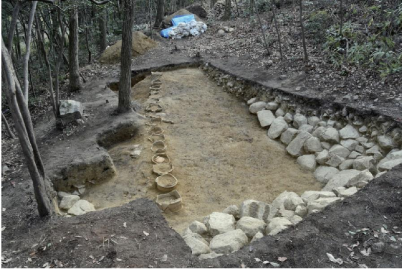
令和3年度発掘調査時 くびれ部の後円部第2段テラス（西から）