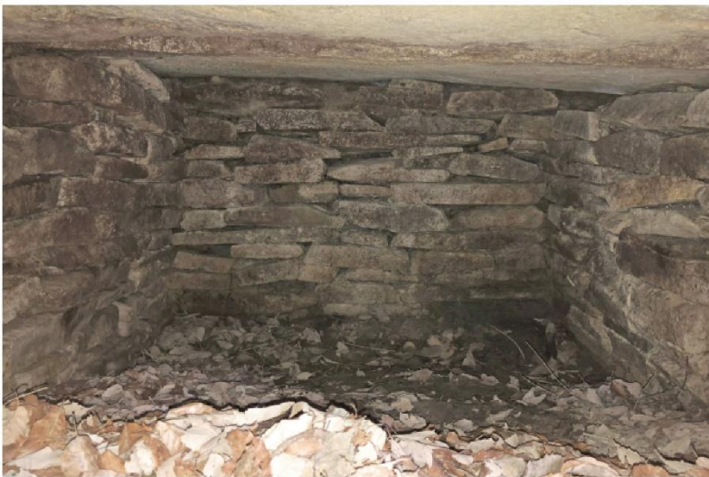
後円部南石室現況（西から）