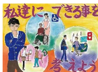
昨年度ポスターの部 最優秀賞作品